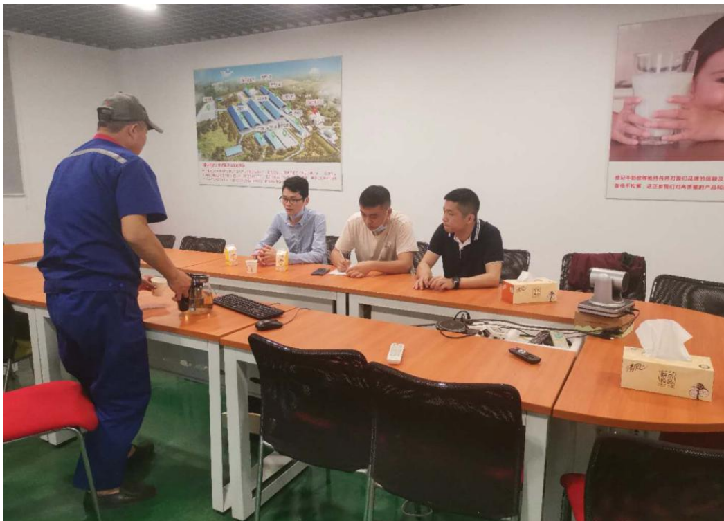
市、区检查人员在佛山澳纯乳业有限公司检查奶牛的养殖档案情况