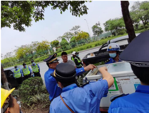
(违法当事人配合城管部门工作，接受处理)