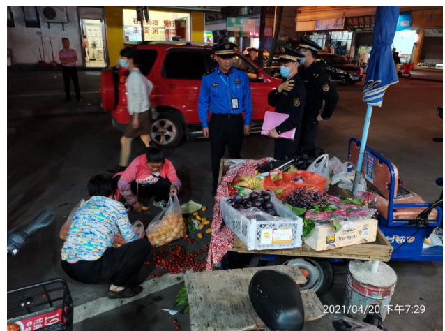
(违法当事人配合执法流程，收拾干净地面)