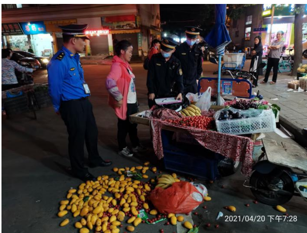
(违法当事人故意对抗执法，拒绝配合)

4月20日晚，专班联合西南街道综合执法办在商业城市场发现三轮机动车游商乱摆卖行为1宗，可违法当事人毅然拒绝配合执法流程，锁三轮机动车、石墩阻挡、故意摔烂电子秤、掀翻水果、恶意报警、出言辱骂，企图逃避责任，对抗执法。经执法人员1小时耐心解释劝导和严肃批评教育，违法当事人承认错误，按要求清理污染路面。