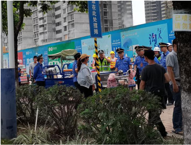
(执法人员对违法当事人耐心解释和宣传教育)