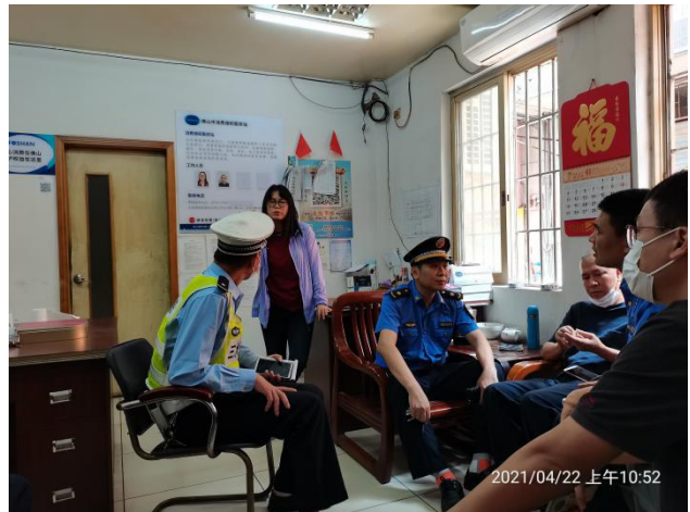
(专班约谈园林市场物业管理方)