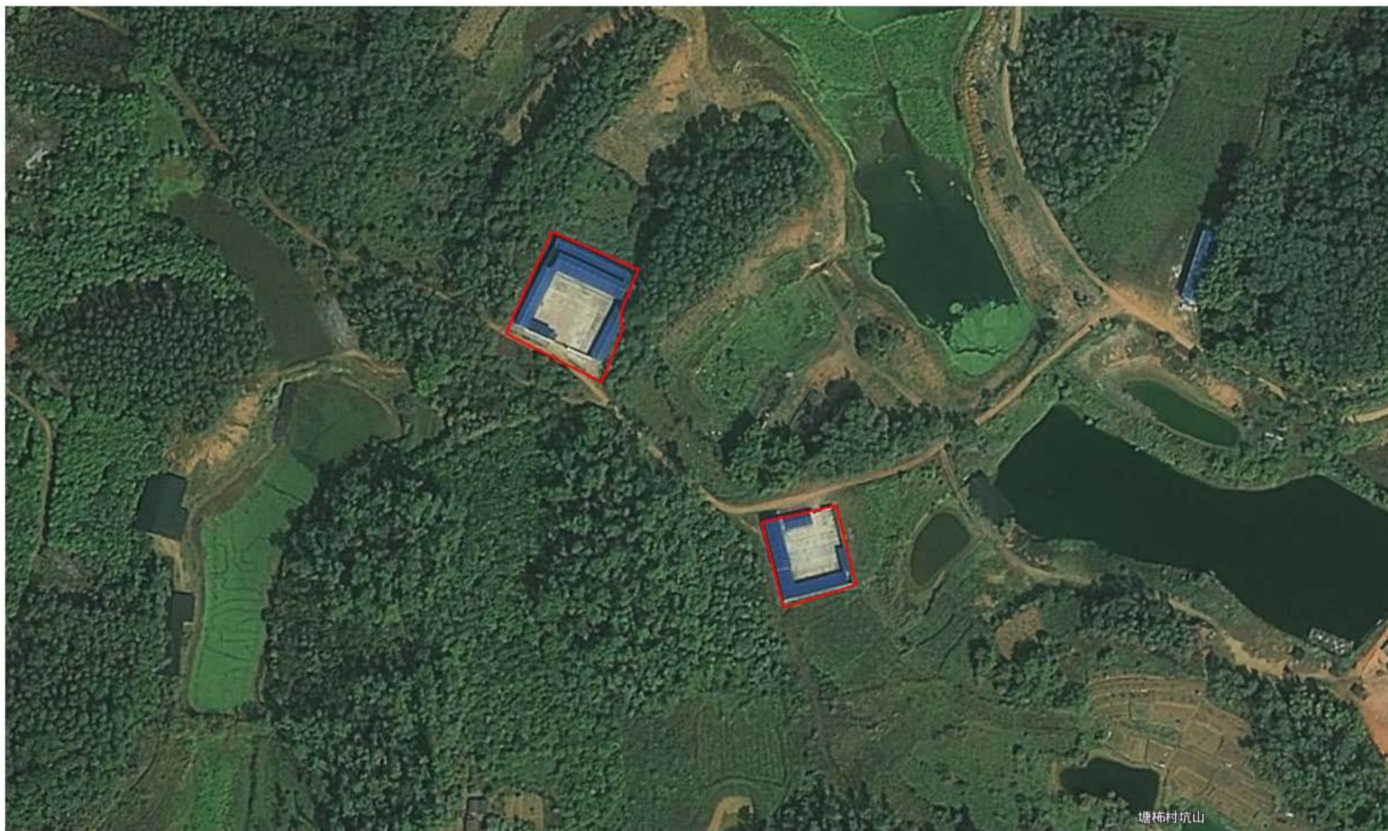
尼克佛山文化生态海岸项目配套工程临时用地影像图