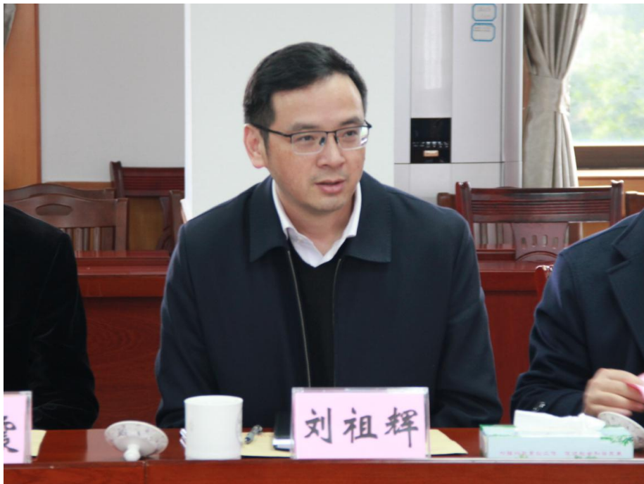
图为佛山市司法局刘祖辉局长讲话

效，将全面依法治区各项工作往前赶，走在前。二是 锻造司法行政工作品牌 。坚持围绕中心服务大局，以高标准打造司法行政品牌为目标，充分发挥司法所职能作用，解决基层群众关心的热点难点问题，塑造司法行政工作品牌，建设营造良好的法治环境。三是 紧抓机遇，提前谋划 。三水作为佛北战新产业园建设主战场，三水区要以此为契机，狠抓落实，优化司法服务平台，同时进一步推广《三水区促进律师行业高质量发展扶持办法》，引入优质律所、律师人才，提供全面法治保障和优质法律服务，助力打造一流营商环境，为佛北战新产业园建设提供司法服务。