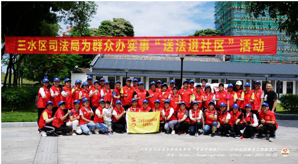
图为“送法进社区活动”