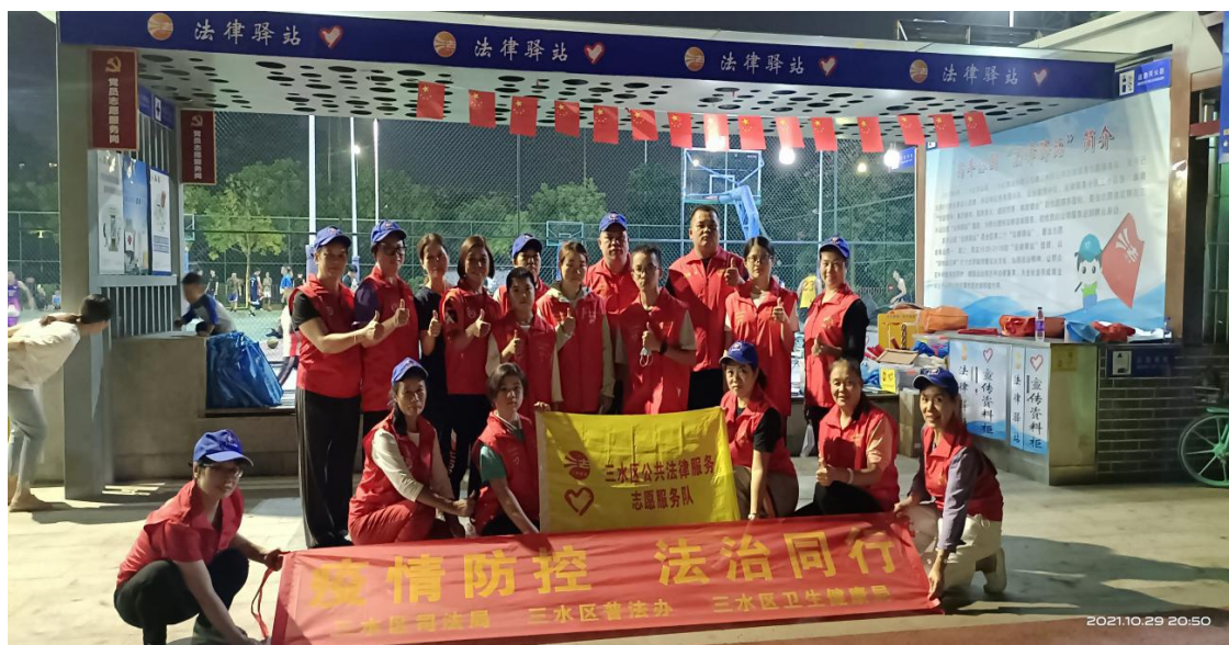
图为“防控疫情 法治同行”宣传活动

下来，三水区司法局将继续认真贯彻落实习近平总书记对志愿服务的重要指示精神，进一步弘扬“奉献、友爱、互助、进步”的志愿服务精神，加强对三水公法志愿服务队的管理和指导。同时，大力开展“法企同行 共助营商”公益普法活动，构建社会普法大格局，推动普法志愿服务常态化、制度化。