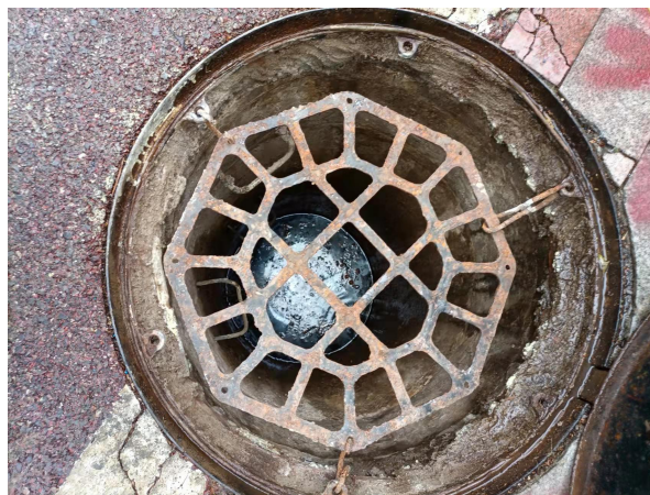
图二：W46 号井盖内挂有铁质滤网格，井内有积水，水面距井口约 1.5 米，井深约 4.5 米。