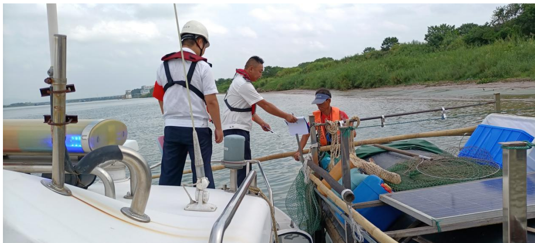
现场派发安全单张

治制度，要加强联合执法与船员培训力度、信息通报机制等，共同做好国庆节及以后一段时间的渔业安全生产工作。