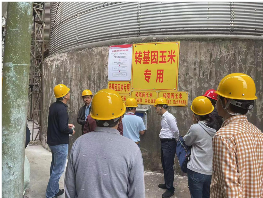
省农业农村厅评审工作组开展现场评审