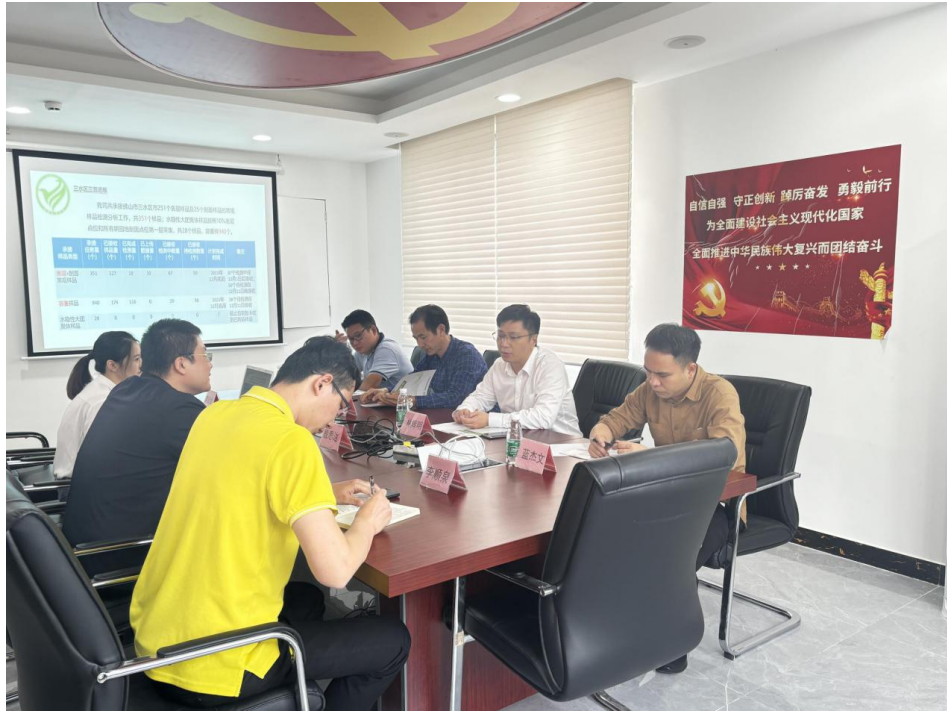
三水区第三次全国土壤普查质量控制工作座谈会