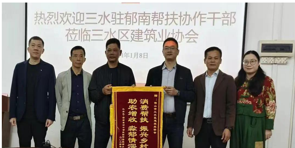
为三水区建筑业协会送上锦旗