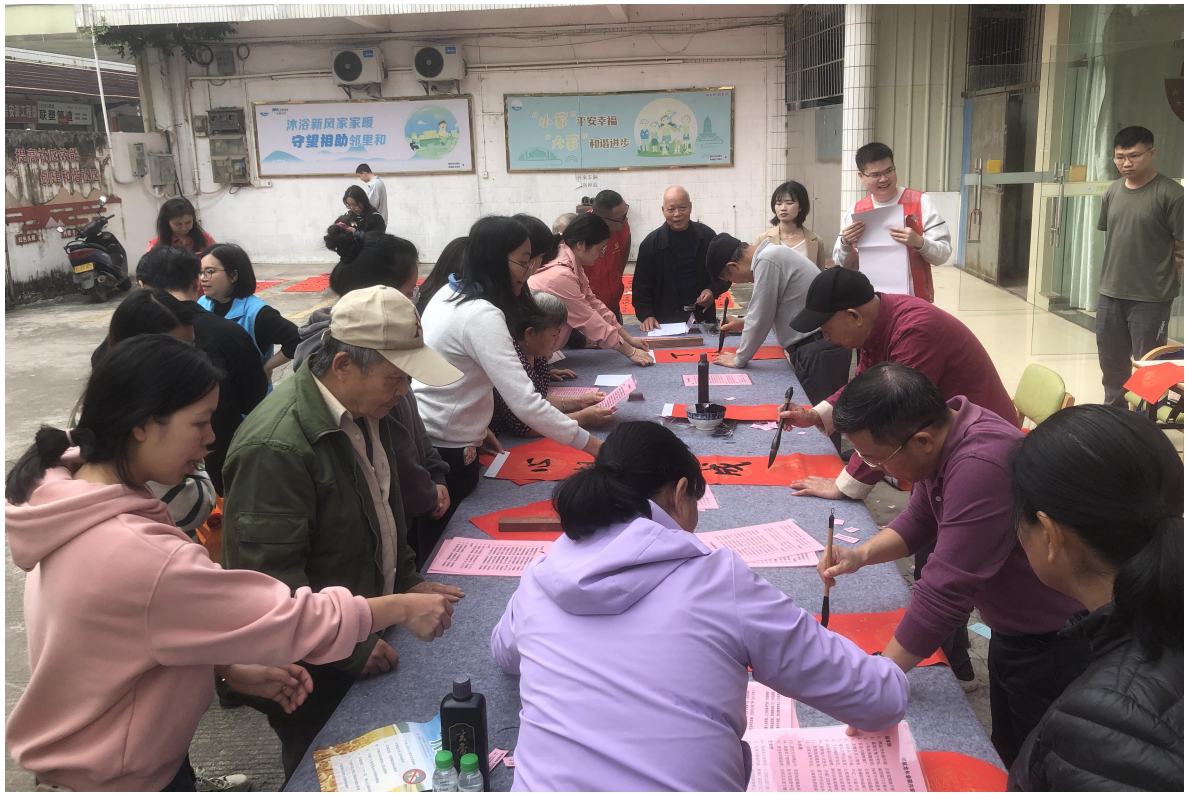
淼鼎乡村振兴文化下乡春节系列志愿服务活动现场