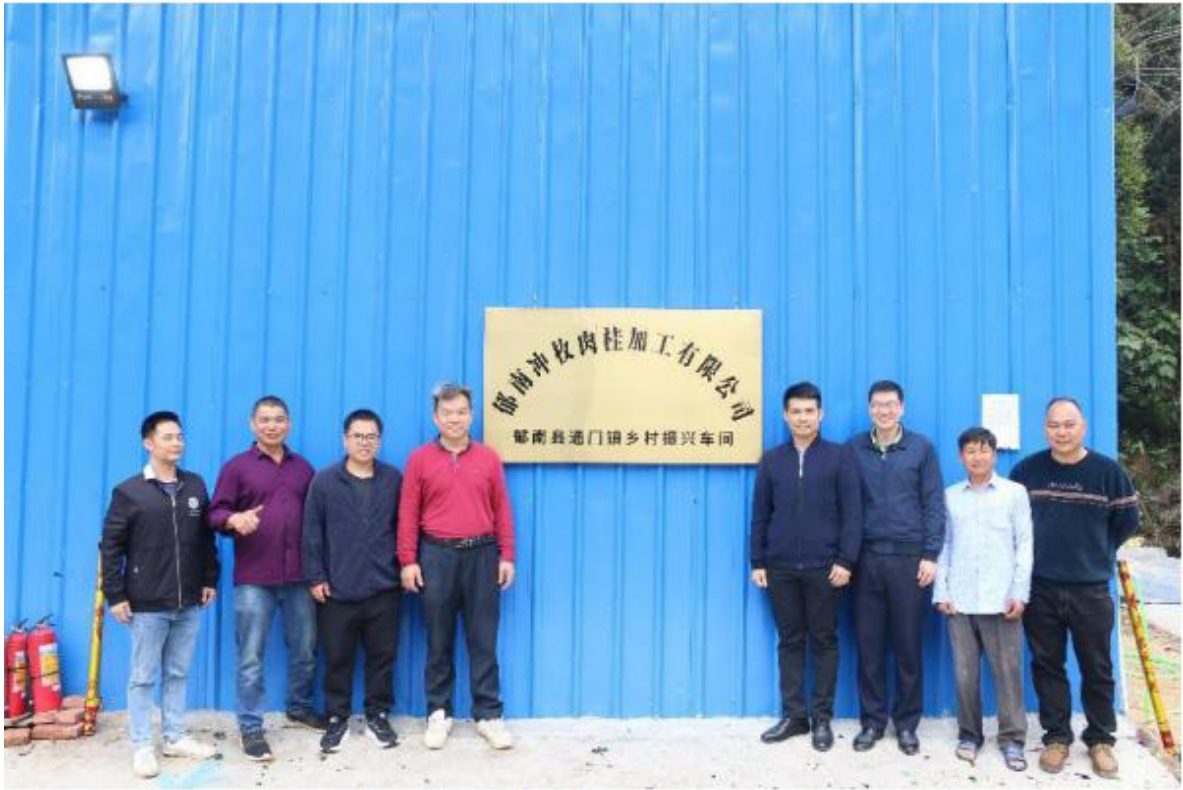
郁南县通门镇郁南冲枚肉桂加工有限公司乡村振兴车间揭牌