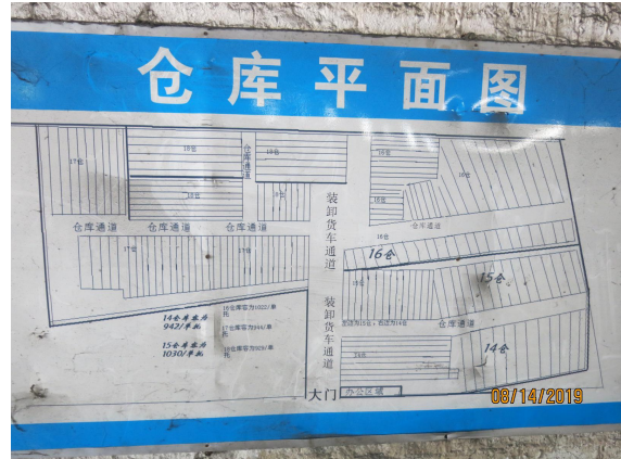
(左图是仓库正门，右图是仓库平面图)