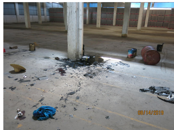
(左图是事发后仓库顶棚遗留的方形窟窿，右图是方形窟窿下方地面遗留的物品)