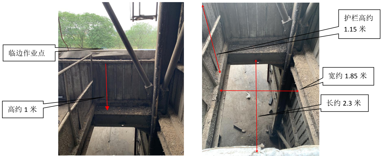
二楼作业和坠落区域