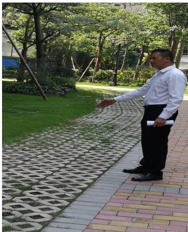
上图显示：9座楼顶天台